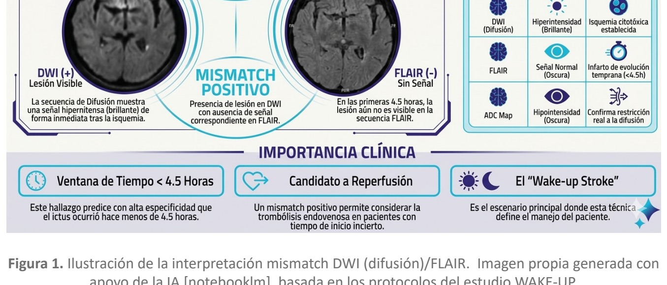
Figura 1. Ilustración de la interpretación mismatch DWI (difusión)/FLAIR. Imagen propia generada con apoyo de la IA [notebooklm], basada en los protocolos del estudio WAKE-UP.

Los estudios de control evidenciaron una pequeña lesión isquémica residual y una transformación hemorrágica mínima (PH1) sin repercusión clínica, confirmando que el manejo guiado por resonancia permitió salvar tejido cerebral, cuya causa se atribuyó finalmente a una placa inestable en la carótida interna izquierda que requirió intervención endovascular.